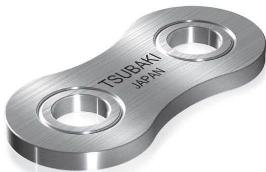
Fig. 13 Placa eslabón de conexión con anillo acuñado

El eslabón de conexión con anillo acuñado de TSUBAKI permite que la especificación de la cadena se realice según su potencia máxima en kW.